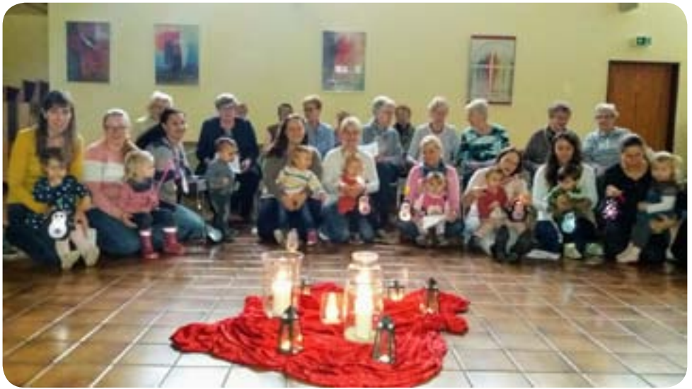
Die Kleinsten aus der Gemeinde singen gemeinsam mit ihren Müttern und der Handarbeitsgruppe Sankt Martins-Lieder.